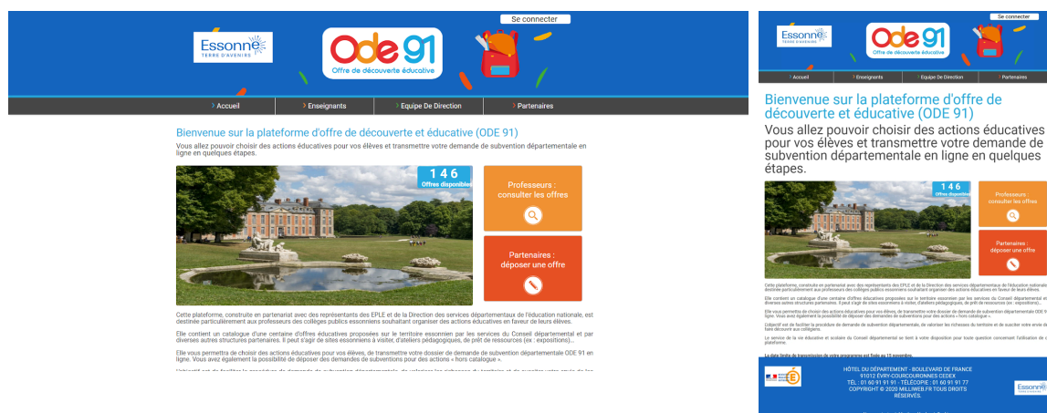
Le site du département avant ma mission:

On constate que sur une taille/format mobile/tablette, ni le contenu, ni la taille ne s'adapte, et il est donc inutilisable sur ces deux médias (sans prendre en compte toutes les incohérences de style)